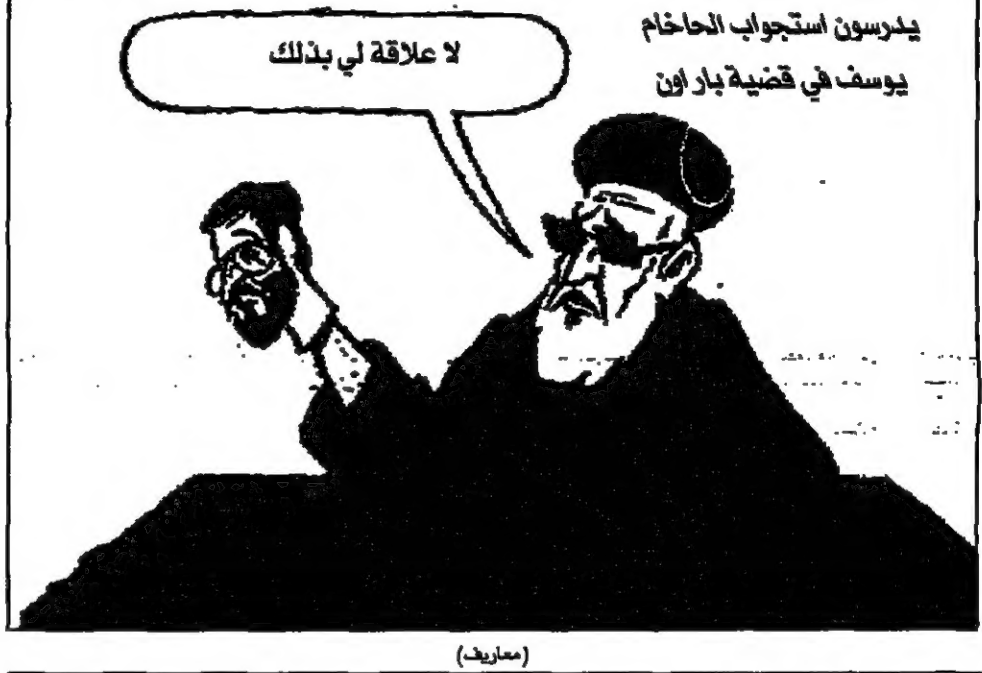
يخبرون استجاب الحاخام يوسف في قضية بارون لا علاقة لي بذلك

وان كان الحاخام عوفاديا يوسف يقول في خطابه العنيفة بان قادة الحركة العلمانية اسوأ مما كان اليهود، انا فمن الطبيعي ان يستجيبوا لتأييده وانصاره من ذلك انهم غير مقولة بالتحقيق معه، وباتي التعبير والجانب الاشكالي جدا لمقاومة ومعارضة التحقيق في الحاخام عوفاديا من خلال حشد الشيطان الكافي، شاس اخذت عاتقه ان تكون صاحبة النهضات الاحترازية الخلفية السفاردي ولكن على ارض الواقع يشك بان يكون احدا من قدسب في هذا القبر الكبير من الاضرار لهيئة الكورن، والسفارديم اكثر من اربعة مئة، وهذا الضرب بالاسلام في وضع مبرهن عموما، الكورن ناهي عن كل من شاس عندما انا انه لا يتخذ ان تظلم الكورن في رؤس الشكوة العلمانية اهارون بيرك الازهر، ويبدو انه من خلال قوله هذا ان يراه قد اقبل بالفعل بشهواته ولم يمتد الى ذلك بيس بقدرته واحترامه. منذ بدء القضية يحاول مدعي تثبت ادعائه بان للحكمة لتلاصقه وملائقته معاشا ملائمة شاس والجمهور السفاردي، لكنه لا انه لم ينجح في ذلك حتى الان، فاسم كبير من الجمهور السفاردي في نفسهم ولا يتشاركون في رؤس الشكوة العلمانية اهارون بيرك الازهر، ويبدو انه من خلال قوله هذا ان يراه قد اقبل بالفعل بشهواته ولم يمتد الى ذلك بيس بقدرته واحترامه. منذ بدء القضية يحاول مدعي تثبت ادعائه بان للحكمة لتلاصقه وملائقته معاشا ملائمة شاس والجمهور السفاردي، لكنه لا انه لم ينجح في ذلك حتى الان، فاسم كبير من الجمهور السفاردي في نفسهم ولا يتشاركون في رؤس الشكوة العلمانية اهارون بيرك الازهر، ويبدو انه من خلال قوله هذا ان يراه قد اقبل بالفعل بشهواته ولم يمتد الى ذلك بيس بقدرته واحترامه.